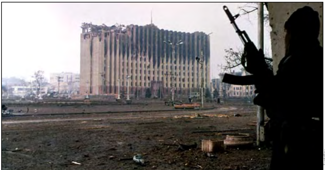
Palais présidentiel de Grozny partiellement détruit lors des combats de l'hiver 1995.