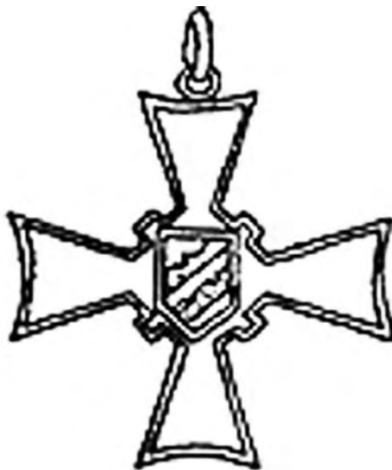
Ci-dessus : Croix de l'Ingrie, dite Croix du Mur blanc. De deux modèles, doré (dans ce cas, orné à l'arrière d'une couronne de lauriers) et argenté avec l'écusson doré en son centre, son ruban était composé de deux larges bandes jaunes, séparées au centre par une bande bleue liserée de deux étroites bandes rouges.